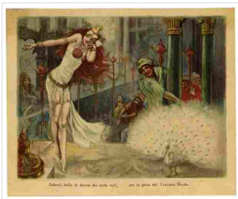
Pubblicità profumeria Tosi, Milano; calendarietto al profumo 'Ora Mistica'

Al Museo della Figurina arrivano i capolavori dell'Art Dèco: la comunicazione della "profumeria artistica" che esalta il mito della bellezza